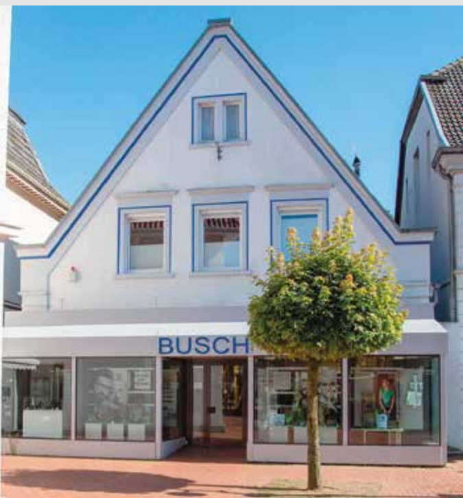
Wir freuen uns auf Ihren Besuch!